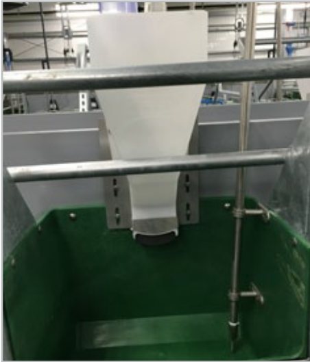
КОРМУШКА AD-LIB Артикул 560037

Неограниченное кормление свиноматок даёт почти на 2 поросенка больше на помёт